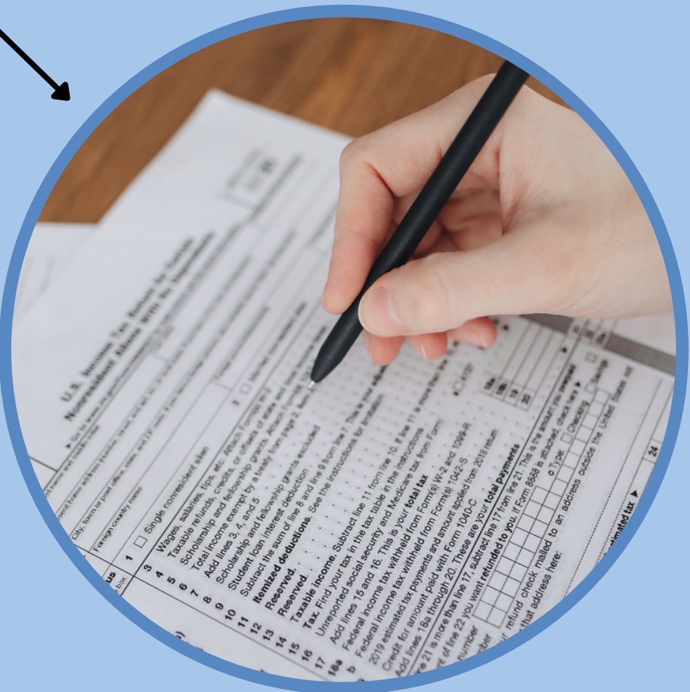
Formulario en papel